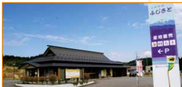
▲藤里町にある「白神街道ふじさと」

世界遺産・白神山地が育んだ、ミネラルたっぷりのたけのこを求め、町内外から多くのお客さんが訪れる『たけのこ祭り』。当日はたけのこの他、旬の山菜など多くの直売品も販売され、山の幸を満喫できるイベントとなっています。