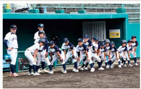
健闘した準優勝の「藤里クラブ」