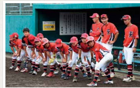
優勝を果たした「淳城南小学校野球部」