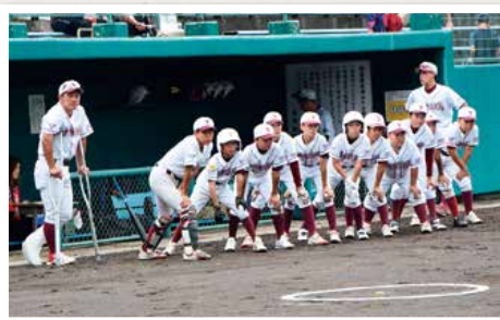
優勝目指した「能代第四小野球クラブ」