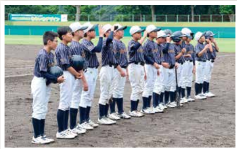
負けて悔いなし「能山Jr」