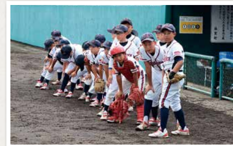
昨年の代表「向能代ファイターズ」