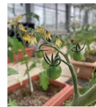
実がなったミニトマト

野菜専攻では、温室の中でミニトマトとキュウリの栽培が始まりました。どちらも、花が咲き実が大きくなってきています！収穫が楽しみです。