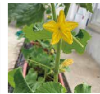
花が咲いたキュウリ