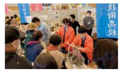
シクラメンは大人気★