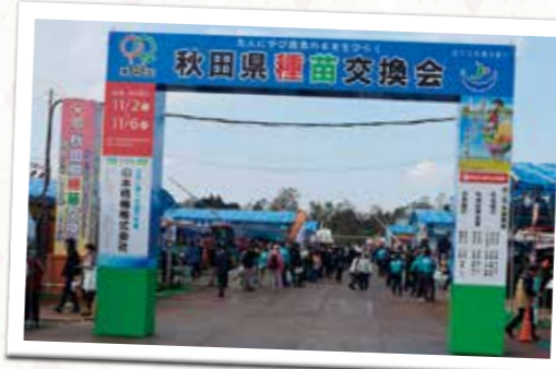
昭和工業団地内で行われた農業機械化ショー入口