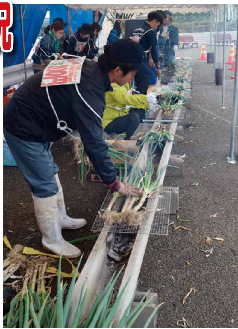
焼いたねぎを無料で提供した「白神ねぎ千本焼き」