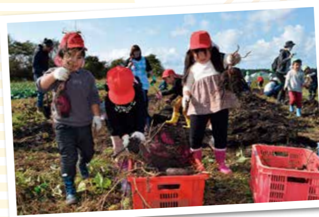
大きく育った大量のサツマイモを収穫カゴに運ぶ園児