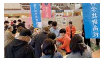
ありがとうございます!