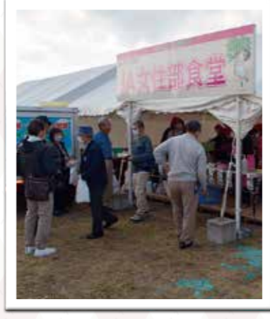
J A 女性部食堂は大盛況