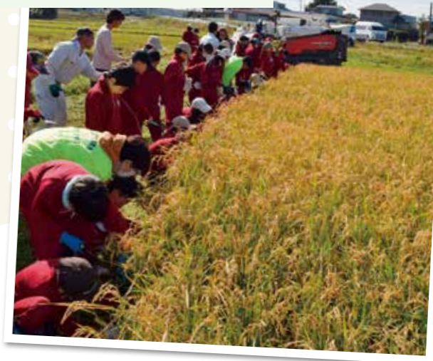
4年生74人が一斉に稲刈りスタート