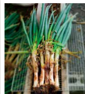
こんがり焼き上がった白神ねぎ