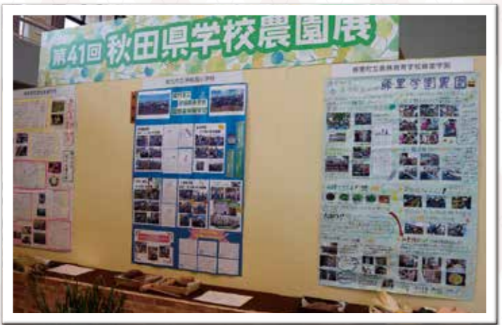
能代淳城西小、藤里学園、能代支援学校が学校農園展に出品