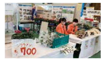
お客様を迎える準備万端!

10月21・22日の2日間、能代市総合体育館で産業フェアが開催され、科技高のブースも設けていただきました。課題研究の内容を展示したり、農業科の農産物・加工品の販売、工業科による体験コーナーなど、普段科技高生が学んでいることを、多くの来場者に知ってもらえる良い機会になりました。両日とも農産物・加工品は開始30~40分程で完売し、体験コーナーの“UF0キャッチャー”と“セメントを使ったキャラクターマグネット作り”も行列ができる程の人気でした!農業と工業が一体となって学ぶ私たちの科技高をこれからもよろしくお祈いします!!