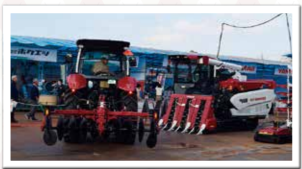
今年も各メーカーが最新機器をPR