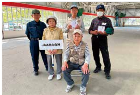
当JA代表として出場した会員の皆さん

第11回「JAバンクあきたグラウンド・ゴルフ大会」が10月13日、潟上市で開催されました。 年金友の会の会員相互の親善と融和を深めることを目的に県域12JAの各大会を勝ち抜いた代表27チーム135人が参加。32ホールのトータルスコアを競い熱戦が繰り広げられました。 当JAからは7月に開催した大会の上位入賞者5名が出場。惜しくも入賞とはなりませんでした。が、秋空の下プレーを楽しんでおりました。