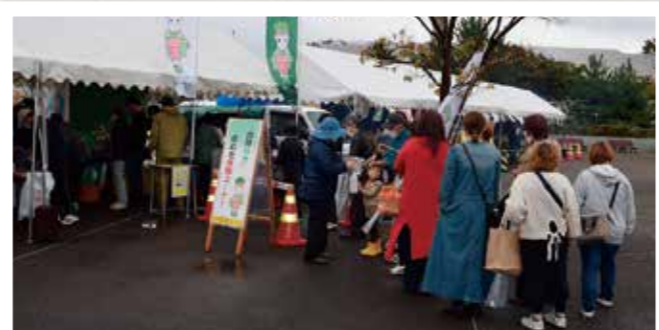
皮むき体験に長い列