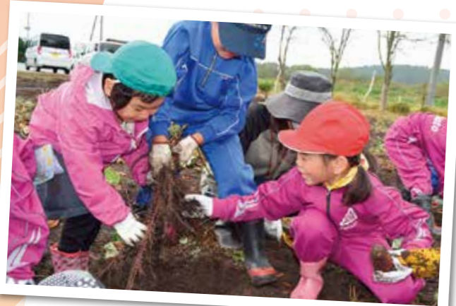
大きいサツマイモが掘れたと大はしゃぎ

対する食農活動を支援しており、大切さを伝えるため、多くの活動部と連携して、子どもたちが「育で、食の現場と生産の現場を近づちをサポートしているJAと青年