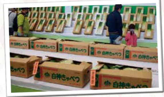
白神きゃべつ・白神ねぎが並び、産地をPR