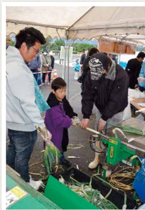
機械を使ったねぎの皮むき体験が人気