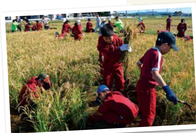
慣れない手つきで稲を刈り、悪戦苦闘