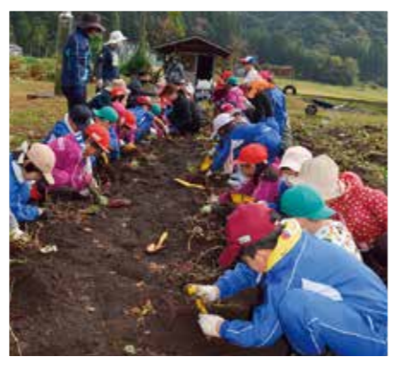
幼稚園年長さん、1年生、2年生が仲良くイモ掘りスタート