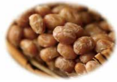
取材協力：全国納豆協同組合連合会 URL: https://www.natto.or.jp

納豆はご存じの通り、熱を加えて軟らかくした大豆を納豆菌によって発酵させた発酵食品です。古くから健康にいいことが知られていますが、近年、新たな研究結果が次々に発表され、再注目されています。