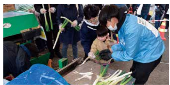
上手に皮をむくことが出来たかな