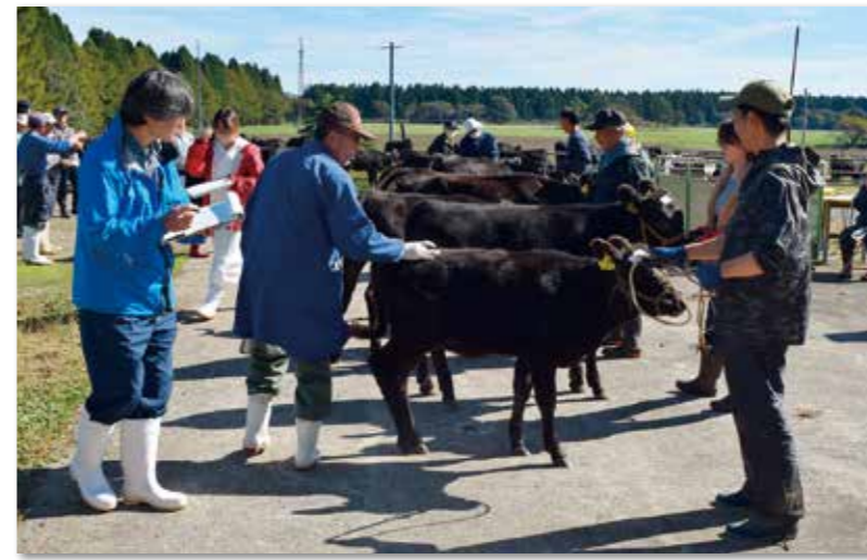
一頭一頭子牛を審査する審査員