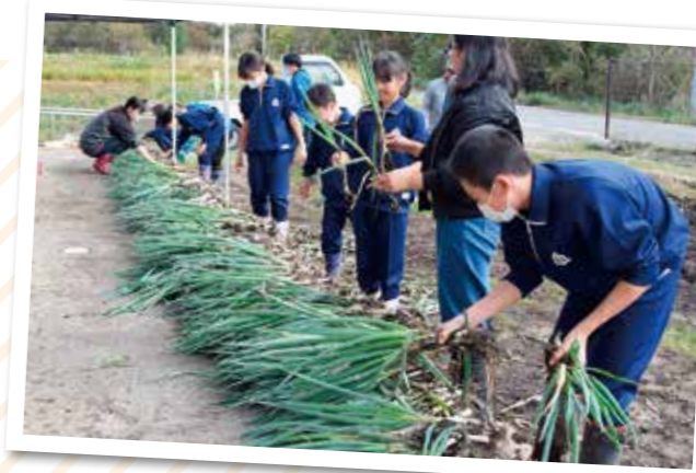
掘ったねぎの中から、販売するねぎを選別する児童

浅内小学校5年生は10月27日、総合的な学習の時間で定植し育ててきた地元特産品のねぎの収穫並びに皮むき・袋詰め作業を行いました。(株)あさかわファーム代表とJA職員の指導の下、白神土ねぎとして120袋(1kg)準備。収穫されたねぎは、29日に開催された同校の「学習発表会」で保護者や地域住民を対象に1袋100円で販売し、あっという間に完売となりました。