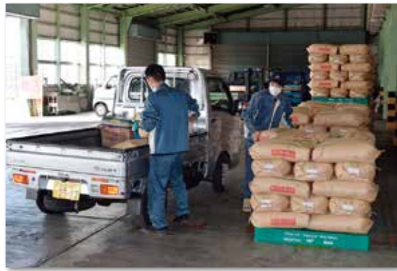
ドライブスルー方式で新米を積み込むJA職員