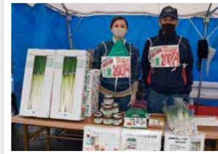
白神ねぎは1束200円で販売、売れ行き好調!