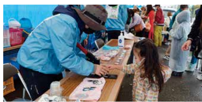
子どもに人気だった缶バッジ制作