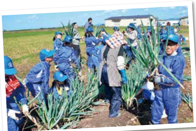
ねぎ掘りに挑戦する浄城西小の児童たち

浄城西小学校5年生は10月3日、農業体験学習農場でねぎとサツマイモの収穫を体験しました。畑作体験は食や農業の大切さを子どもたちに伝えようと女性部が主体となって実施。今年度4回目となった畑作体験では大きく育ったねぎとサツマイモを収穫し、実りの秋に笑顔を見せておりました。