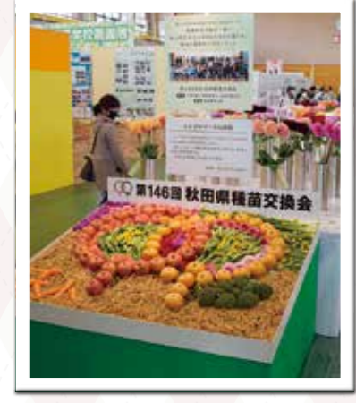
種苗交換会のシンボルマーク