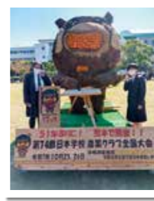
熊本大会キャラクター「クマツカ」