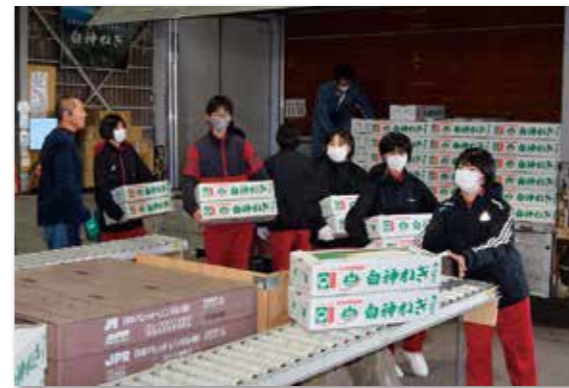
白神ねぎの集荷作業を体験する能代東中生徒

きみまち二ツ井マラソンが10月15日開催され、当JAではマラソンにエントリーしたランナーを応援しようと参加者全員に「白神ねぎ」をプレゼントしました。 白神ねぎは2Lのサイズ54kg(1kg5kg入り)、本数で1620本を準備。 マラソンには全国から集まった1531人のランナーが出場。「白神ねぎ」をプレゼントされた参加者らは、沿道で声援を受けながら「きみまち路」を快走しておりました。