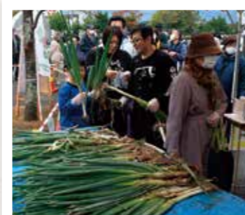
皮むきのねぎを選択する来場者