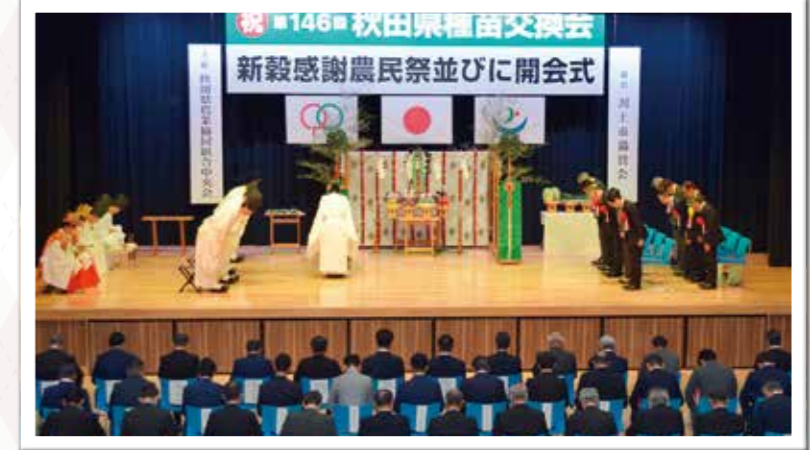
新穀感謝農民祭は厳かな雰囲気の中で