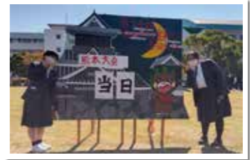
いよいよ本番当日!!