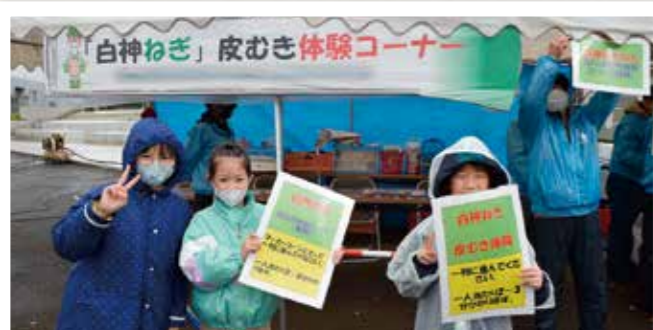
皮むきを呼び込む淳南小学校の児童