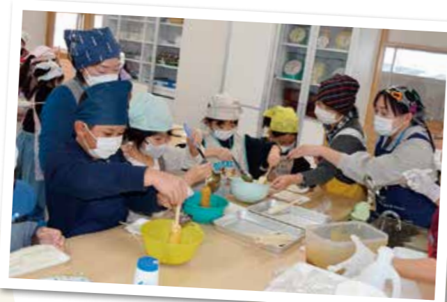
焼いたたんぽに自作のみそをつける児童

藤里学園3年生17人は10月25日、地元産の材料を使った「みそたんぽ作り」にチャレンジしました。味噌は今の3年生が昨年収穫した大豆を、6月に仕込んだみそを使用。女性部員3名のレクチャーを受けながら、焼き上げたたんぽに自ら作ったみそをぬり、にぎやかに調理。「たんぽはモチモチしていて、みそは甘くて美味しい」と楽しんでおりました。