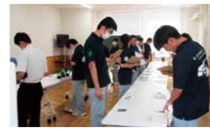
計算問題は難しいなあ。