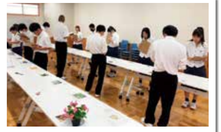
初めての農業鑑定に挑戦

本校で成績の優秀だった生徒は、熊本県で開催される農業クラブの全国大会に出場します。本年も25点を超える生徒が数名おり、全国大会までに切磋琢磨し、より良い成績を残してほしいです。