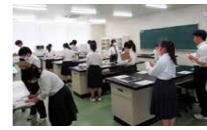
生活福祉の問題に挑戦中…