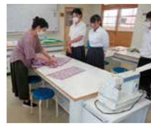
初めての甚平作り