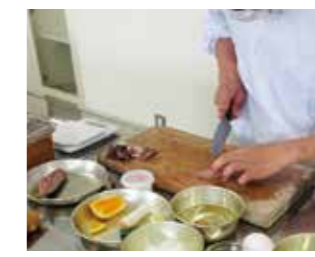
あじの3枚おろしに挑戦