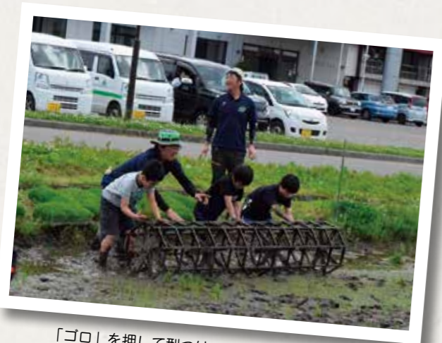
「ゴロ」を押して型つけの指導をする青年部員