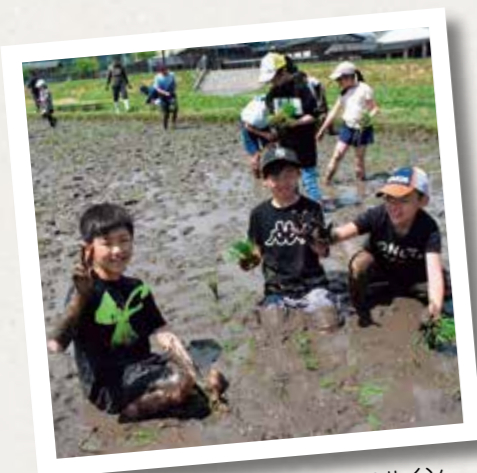
全身泥まみれ！楽しそうにピースサイン