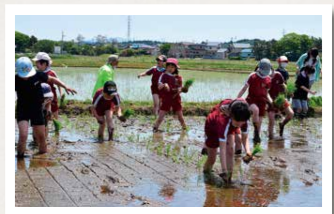
足元を確認しながら、一本一本でいねいに定植