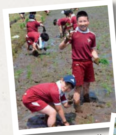
泥んこも平気と、ピースサイン