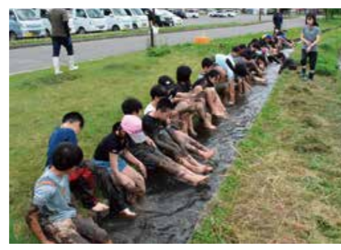
足湯？泥まみれの足を洗い流す児童たち