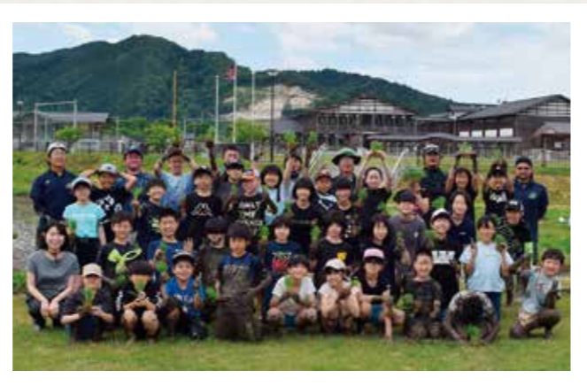
泥んこ姿で記念撮影