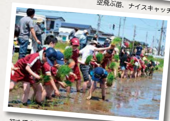
初めての作業に戸惑いながら、植えこみ作業に夢中