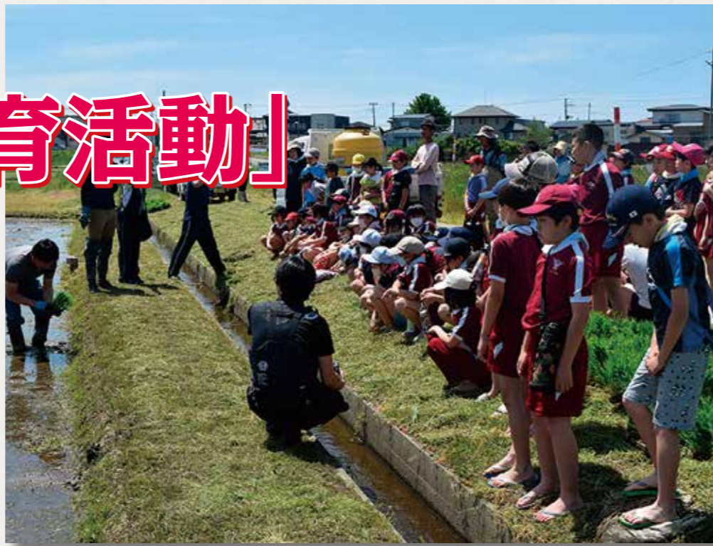
苗の植え方について説明を聞く能代市立第四小学校の児童