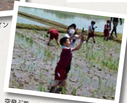
空飛ぶ苗、ナイスキャッチ出来たかな？