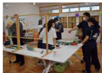
展示会場の準備作業の様子