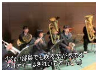
少ない部員でも吹奏楽が奏でるメロデーはきれいです(〇〇)