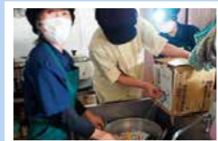
非常用保存水で調理開始!