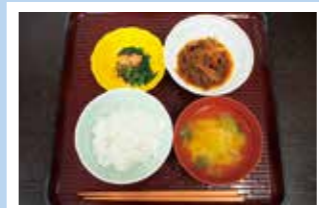
以外に好評であった非常時の食事