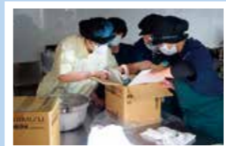
非常食の内容を確認する厨房スタッフ