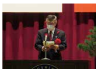
秋田県知事からは祝辞以外にも激励の言葉をいただきました😊

10月23日(土)秋田県知事、秋田県教育長ほか11名の来賓をお招きして開校式を行いました。秋の空を象徴するような変わりやすい天候でしたが、参加者みんなで盛会にすることを心がけ約1時間の式典を無事に終えることが出来ました。帰りのHRで担任の先生を通じて、来賓の皆様から座る姿勢や国歌、校歌斉唱の声の大きさなどについてお褒めの言葉をいただいたことを聞きました。