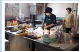
部屋を暗くし、懐中電灯頼りに調理しました。