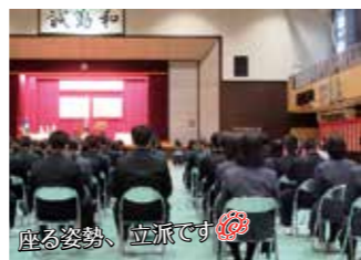
座る姿勢、立派です😊