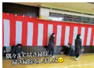
隅々まで拭き掃除、掃き掃除をしました😊