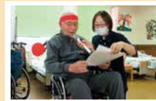
赤ハチマキ巻いて気合十分。元気に選手宣誓!

いなほの里の利用者さんは秋を満喫。秋の大運動会では堂々の選手宣誓の後、紅白に別れて各種目で大熱戦が繰り広げられました。また、別日には利用者さんが新米で「だまこ」を作り、昼食時にだまこ鍋に舌鼓を打ちました。充実した秋を堪能しながら、利用者さんたちは毎日パワフルに過ごしています!