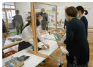
農産物販売は入場制限を強いても大盛況でした😊

10月1日(金)第1回科技高祭が開催されました。新型コロナウイルス感染症拡大防止のため、今年も一般公開は見送られました。生物資源科では、学科の特徴を理解してもらう目的で生徒を対象に農産物販売を実施しました。「あきたこまち」の新米のほか、サツマイモやナス、白神ネギ、シクラメンのほか草花専攻生が製作したハーバリウムを販売したところ、1時間ほどで完売。特設コーナーとして設けた実物鑑定体験にも100名を超える生徒が挑戦してくれました。次年度は、是非一般公開をして多くの方々に来ていただきたいです。