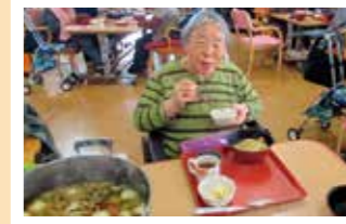
新米だまこ鍋! 熱々で最高です!