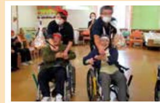
利用者さんと一緒にスタッフも本気に? 白熱のパン食い競争!