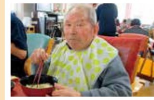
秋の醍醐味を堪能!