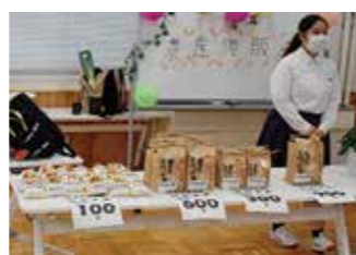
今年度産「あきたこまち」は、あっという間に完売でした

10月1日(金)第1回科技高祭が開催されました。新型コロナウイルス感染症拡大防止のため、今年も一般公開は見送られました。生物資源科では、学科の特徴を理解してもらう目的で生徒を対象に農産物販売を実施しました。「あきたこまち」の新米のほか、サツマイモやナス、白神ネギ、シクラメンのほか草花専攻生が製作したハーバリウムを販売したところ、1時間ほどで完売。特設コーナーとして設けた実物鑑定体験にも100名を超える生徒が挑戦してくれました。次年度は、是非一般公開をして多くの方々に来ていただきたいです。