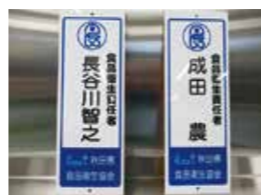
講習を受けた先生方の資格証

生物資源科アグリビジネスコースでは、学校で生産した農産物などを使って加工品の生産を行う授業があります。製造実習で作った商品を販売するためには「食品衛生責任者」の資格取得が必要でしたが、10月14日に能代山本広域交流センターで行われた養成講習会に2名の先生が参加し、資格を取得してくれました。今後は「みそ又はしょうゆ製造業」の営業許可申請をして3学期に味噌づくりに挑戦します。R5年に販売予定です。