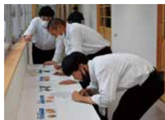
農業鑑定競技に挑戦する工業科の生徒の皆さん