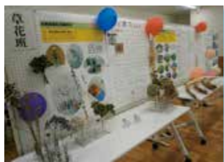
各部門の活動紹介もしました