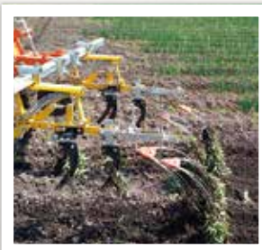
オリジナルのネギ除草機