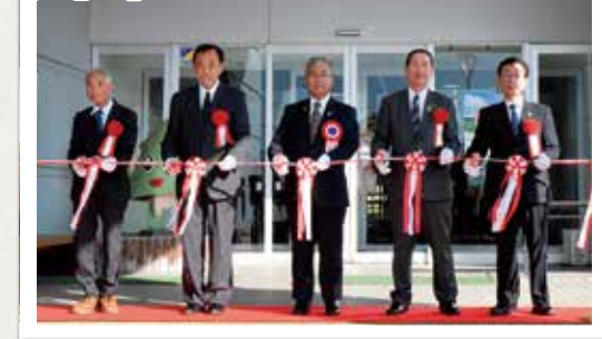
テープカットの様子は、下記QRコードでご視聴できます。