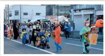
ちんどん隊が先導したハロウィンパレード