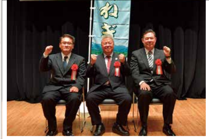
長時間に及ぶ討議お疲れ様でした。

「白神ねぎ」がリードする秋田県産ねぎの更なる生産拡大に向けて、今後の取り組み方向と目的を話し合いました。話し合いは「各地域、土壌に合ったオリジナルの機械化の普及が更なる面積拡大のカギとなる。農業試験場をはじめとした行政、各種メーカーも交えた開発する機会を設けてもらいたい」と、人手はどうしても必要となる。雇