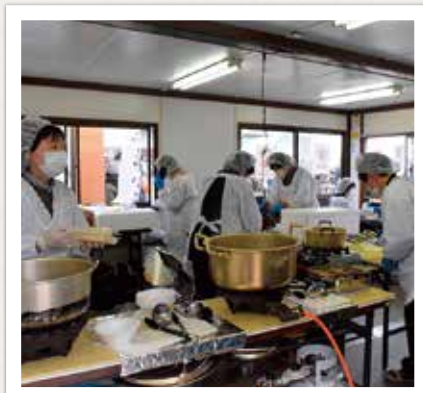
心を込めて調理する女性部員