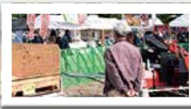
管内ではお馴染みの運搬用コンテナも他地域では珍しい器具のひとつ