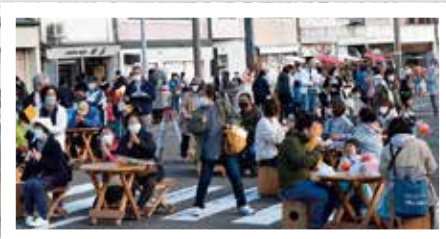
街なかのにぎわいを創出した「のしろいち」