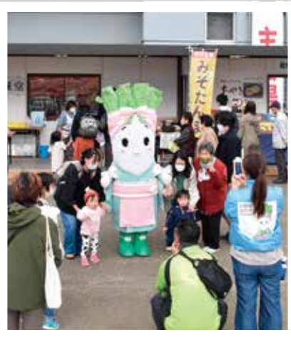
どこでも人気の「白神ねぎのん」