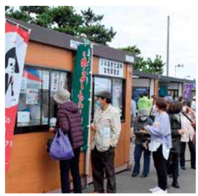
連日完売した女性部特製「きりたんぼ」