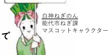
白神ねぎのん 能代市ねぎ課 マスコットキャラクター