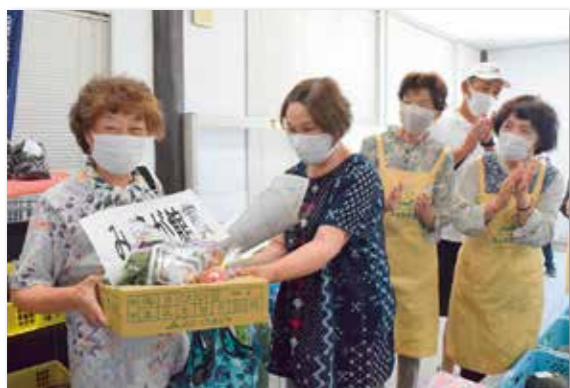
特賞「みょうが館賞」GETに笑顔！（^_^）！