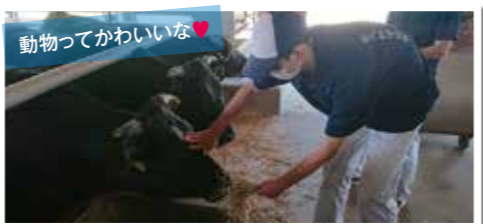
動物ってかわいいな♥