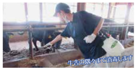
牛舎の隅々まで消毒します