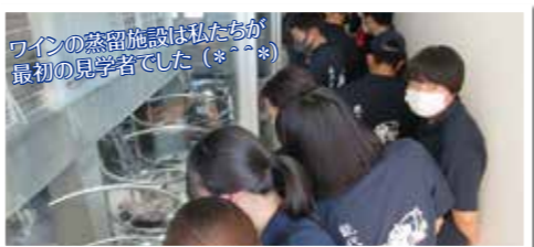
ワインの蒸留施設は私たちが最初の見学者でした (*^▽^*)