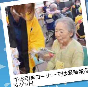
千本引きコーナーでは豪華景品をゲット!