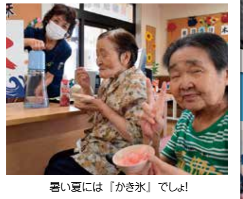
暑い夏には「かき氷」でしょ!