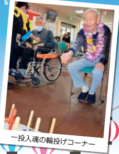
一投入魂の輪投げコーナー