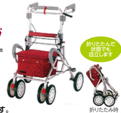
折りたたんだ状態でも自立します