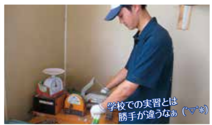
学校での実習とは勝手が違うなあ (*^▽^*)