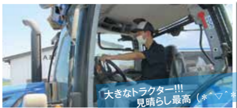
大きなトラクター!!! 見晴らし最高 (*^▽^*)

この事業のメリットとして生徒達は、仕事を体験することで勤労観や職業観を養うことが期待でき、企業側は生徒の働く様子を通して性格的な特徴を把握することができるため、生徒が就職を希望した際に大いに役立っているそうです。この事業により、4年間で8名の生徒が能代市内の農業の現場で働いています。未来の農業従事者の育成のために、この事業が果たす役割は大きいですね。