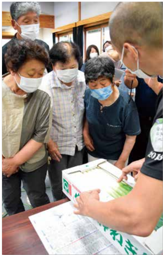
目ぞろい会で入念に確認する生産者