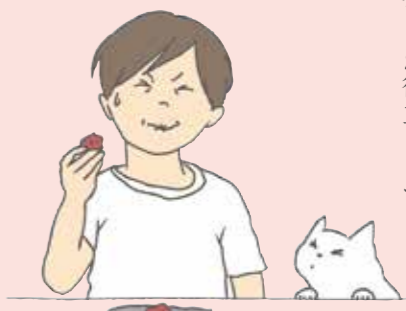
イラスト:石川とるこ

二つ目は、量を調節すること。梅干しの味をはっきり出したいときはたっぷり使いますが、ほんのちよつとだけ使うと、酸味はほとんど気にならず、うま味だけが加わり、隠し味として活躍します。煮物や炒め物、カレーなど、ちよつとこくが足りないな……、そんなときに、たたいた梅干しをちよつと加えてみてください。