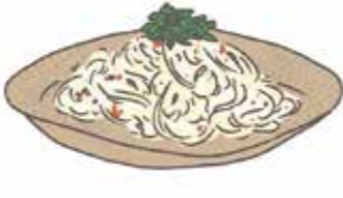
さっぱり梅トマトの 冷製パスタ

★トーストに梅バターを塗るだけでもいい。 ★ハムやチーズ、レタスなど、好きな具材でお試しを。 ★梅バターはゆでたパスタとあえてもいい。 ★余った梅バターはフライパンで温め、しょうゆ少々とレモン汁少々を加えると風味豊かなソースに。焼いた肉やシーフードとあえるとおいしい。