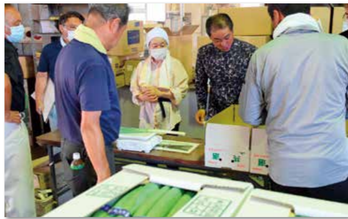
毎週実施される部会員らによる「抜き打ち品質検査」