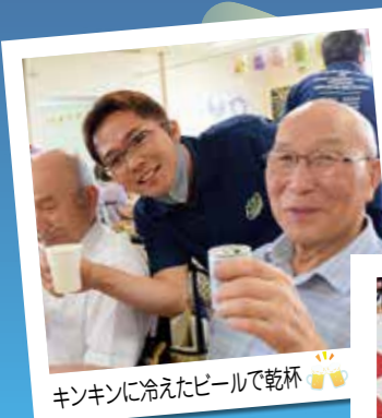
キンキンに冷えたビールで乾杯