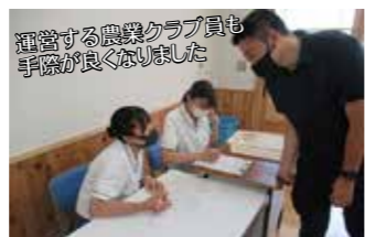
運営する農業クラブ員も手際が良くなりました