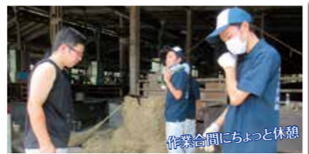
作業合間にちよつと休憩