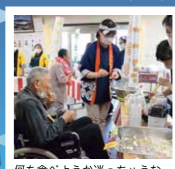
何を食べようか迷っちゃうな~