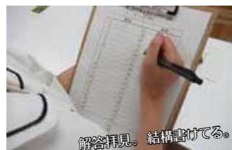
解答拝見。結構書ける。