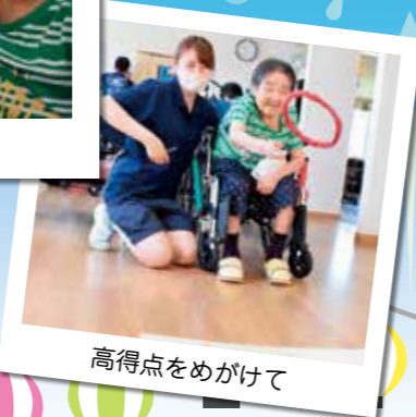
高得点をめがけて