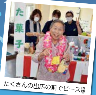
たくさんの出店の前でピース