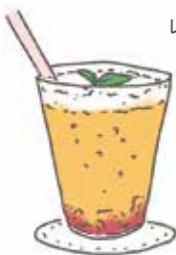
しゅわしゅわ 梅ドリンク

一口に梅干しといっても実にさまざまな味があり、塩辛さや酸味、甘味など、それぞれに異なります。レシピをお試しになる際は、味見をしながら、お好みで梅干しの量を調整してください。