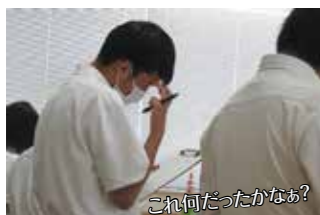
これ何だったかなあ?