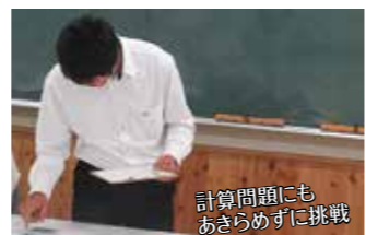
計算問題にもあきらめずに挑戦