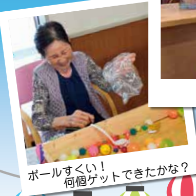
ボールすくい! 何個ゲットできたかな?