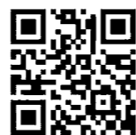
↑メール作成用 QRコード