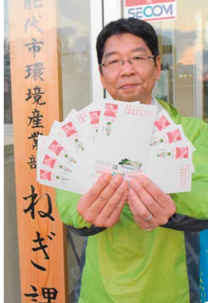
完成した「オリジナル年賀はがき」