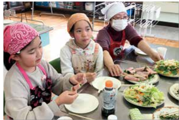
完成したクレソン料理を女性部員と試食