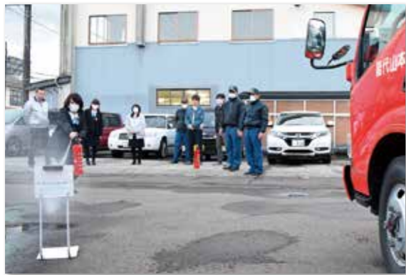
訓練用消火器を使用した消火訓練も実施しました。