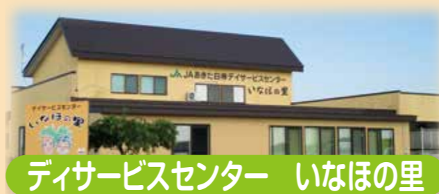
サービスセンター いなほの里