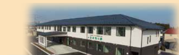
特定施設サ高住 白神憩の郷