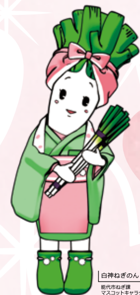
白神ねぎのん 産地市販課 マスコットキャラクター