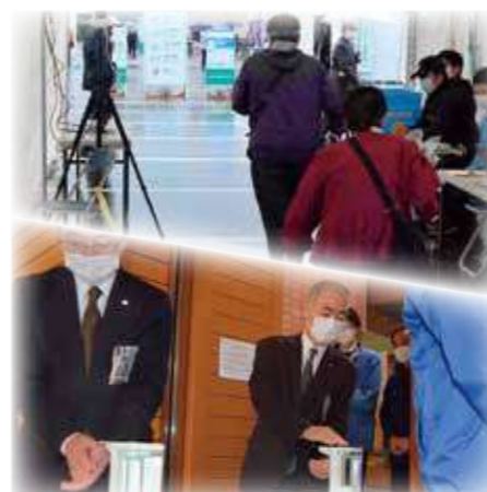
感染症対策万全に開催

2011年以来9年ぶりに横手市を会場として行われました。新型コロナウイルス感染症対策のため、開催期間を例年の7日間から短縮され、メイン行事の談話会や農産物の出品展示などは規模を縮小しながらも行われましたが、毎年恒例の農業機械化ショーや地産地消展など一部イベントは中止となり、各会場では、検温や手指消毒、入場の人数制限などを行いながらの開催となりました。 労働力不足は共通の課題 今回の談話会のテーマ「しいたけ振興の取り組みについて」更なる生産規模拡大に向け、課題となる労働力不足の解消や、高品質を維持できる生産体制の構築、高額の設備費などの共通課題について、生産者やJAの担当者らが生産、流通、販売の各種方面から振興方策を探り認識を共有しました。 各会場賑わい、大盛り上がり 協賛第1会場（横手市体育館）では、地場産品やご当地グルメの販売、協賛第2会場（秋田ふるさと村）では、JA秋田ふるさととの女性部の皆さんが、横手特産の「山内いものこ」を使ったいものこ汁や、うどん、そばなどを提供する女性部食堂や植木苗木市などのブースが設けられていました。その中でも横手市の代表的なご当地グルメ「横手やきそば」のブースには、毎年秋に開催される横手やきそば四天王決定戦を勝ち抜いた歴代四天王が特別出店。長蛇の列が途切れることなく、食べ比べるために両手に横手やきそばを抱える来場者の姿も見られました。