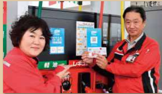
笑顔で収穫や焼芋を体験する児童ら