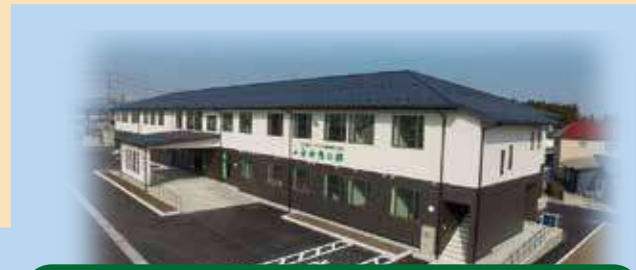
特定施設サ高住 白神憩の郷

認定こども園さかき幼稚園の年長さん37人が白神憩の郷の畑で、サツマイモの収穫作業をお手伝いしてくれて、小さな手で顔よりも大きいサツマイモをたくさん収穫してくれました。入居者さんも園児たちと一緒に収穫作業を行うと、園児たちは最後に「おじいさん、おばあさん、お芋を掘らせてくれてありがとうございます。寒くなりますが、風邪などひかずいつまでも元気でいてください。」と大きなお手紙と元気をプレゼントしてくれました。