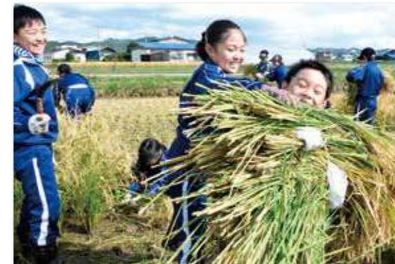
稲を抱き込み全身で実りの秋を堪能する児童