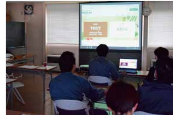
WEB注文サイトについて共通認識を図る