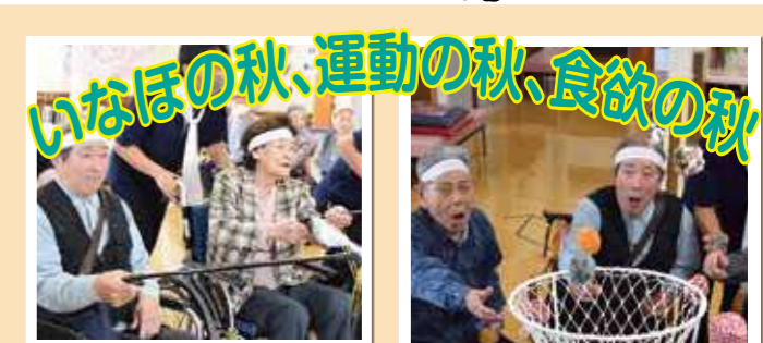
いなほの秋、運動の秋、食欲の秋