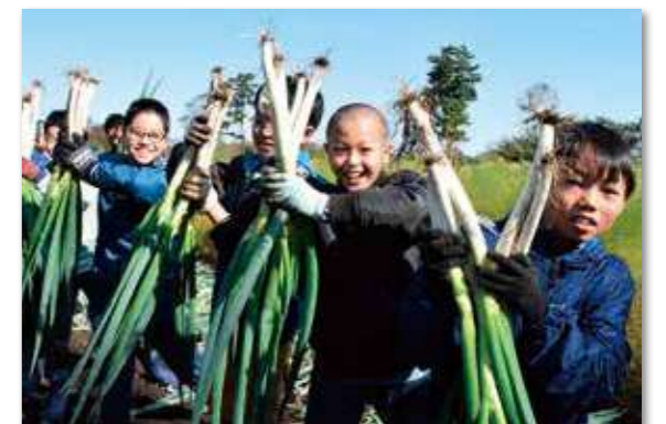
手作業による皮むきも体験しました。

今回収穫したお米は企業体験学習の一環でオリジナル弁当を開発販売を計画しています。