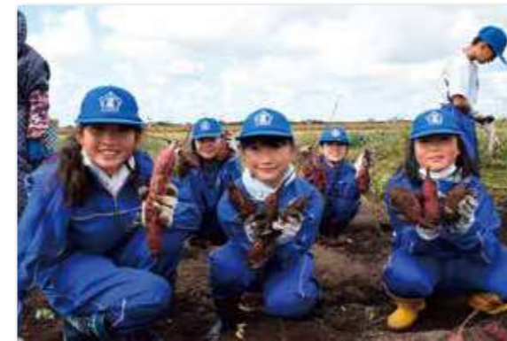
笑顔で収穫や焼芋を体験する児童ら