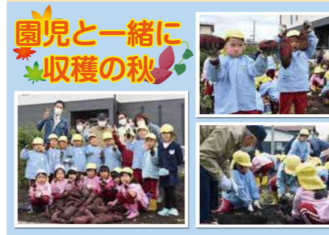
園児と一緒に 収穫の秋

認定こども園さかき幼稚園の年長さん37人が白神憩の郷の畑で、サツマイモの収穫作業をお手伝いしてくれて、小さな手で顔よりも大きいサツマイモをたくさん収穫してくれました。入居者さんも園児たちと一緒に収穫作業を行うと、園児たちは最後に「おじいさん、おばあさん、お芋を掘らせてくれてありがとうございます。寒くなりますが、風邪などひかずいつまでも元気でいてください。」と大きなお手紙と元気をプレゼントしてくれました。