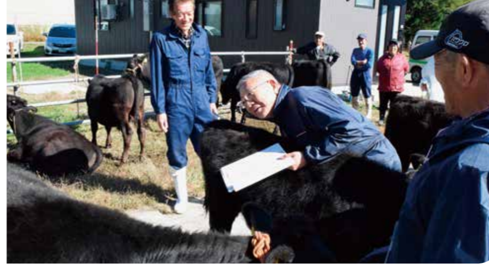
一頭一頭子牛を審査する審査員

臈下運動の一環として「ボケます小唄」など歌ったあと、タオル体操で腕を上げたり、足を伸ばしたりと全身を使った軽運動で心も体もリフレッシュしました。