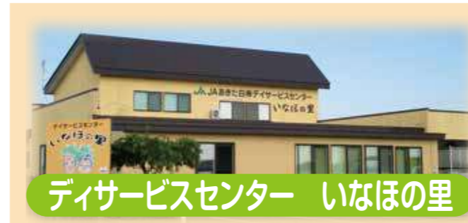
サービスセンター いなほの里