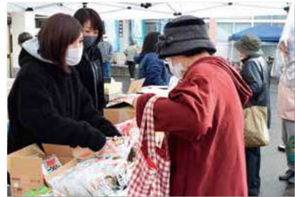
会場内では町の園児や児童・生徒らの作品も展示されていました。