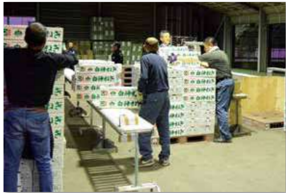
10月23日にはセンター過去最高量となる8,627ケースが出荷される。