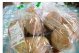
じゃがいも(北あかり) 150円/500g