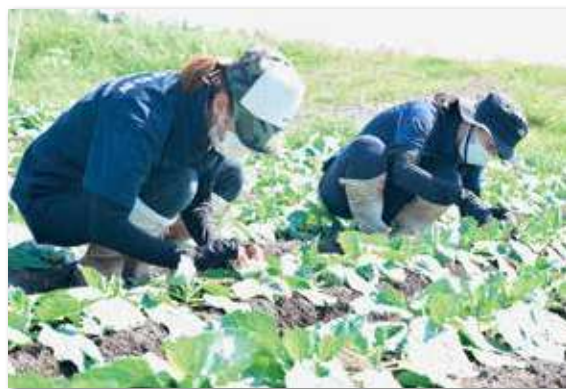
一枚一枚葉の裏側を調べました。