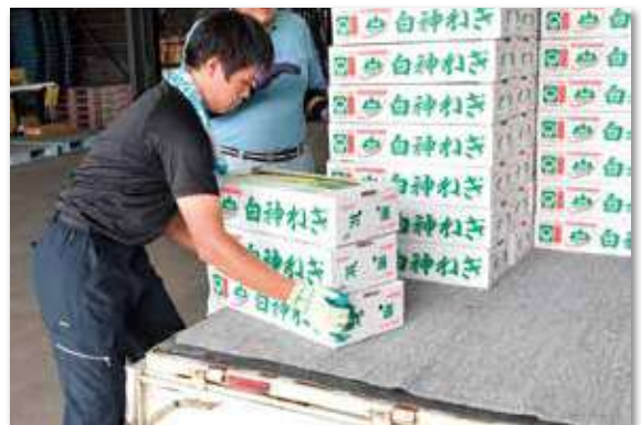
規格毎に荷下ろし作業をする男子生徒

人事・審査課では「就業先の選択肢の一つとして考えてもらえば」と、今後も学生のインターンシップ等を受け入れることとしております。