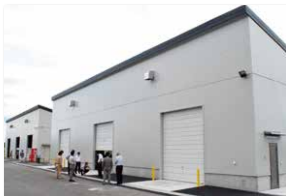
CE資材倉庫の完成検査を行う常勤役員