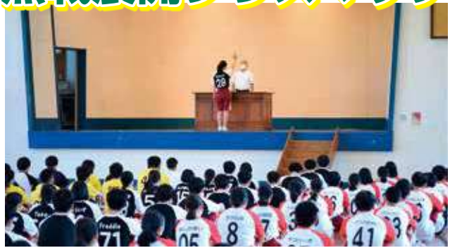
3年生はお揃いのユニークなユニフォームで一致団結