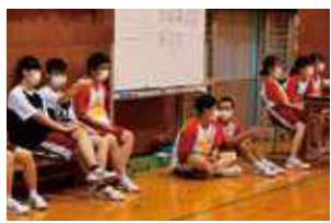
クラスメイトへの応援