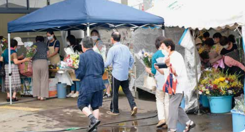
特設コーナーで切り花 を買い求める来場者ら