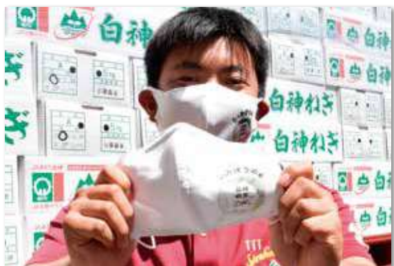
シンボルマークが入ったマスクで「白神ねぎ」をPR