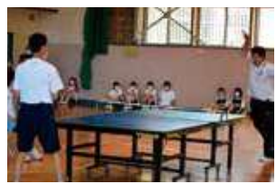
卓球では教員チームを撃破