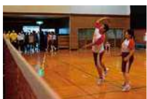
男女混合ペアバドミントン