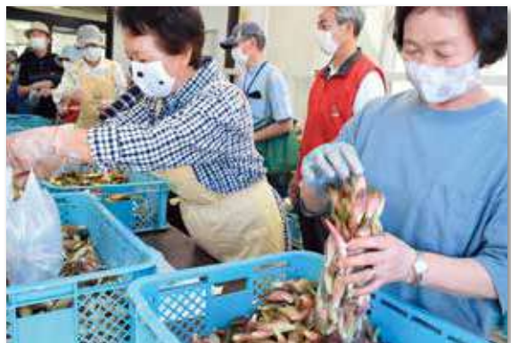
大勢のお買い物客で賑わった袋詰め販売