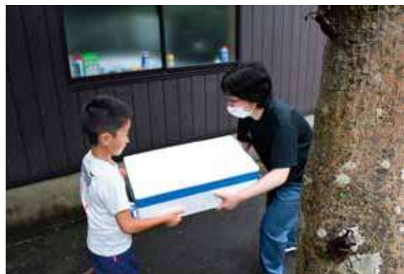
玄関先でBBQセットを受取る小学生