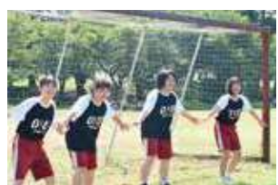
ゴール前 4人並べば 怖くない!