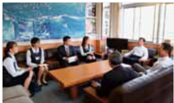
辞令交付後、常勤役員と半年間を振り返り談笑する4名

4月1日付けで採用され6か月間の試用期間を終えた4名が晴れやかな面持ちで組合長から一人一人辞令書を受け取りました。