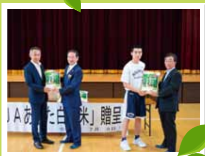
P10 白神米腹いっぱい食べてfight!