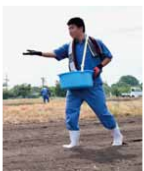
最後には農業クラブの生徒も加わって…