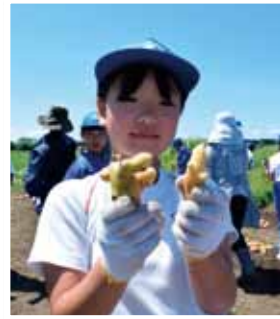
変な形もあったよ～

待ちに待った試食会では女性部長が「チョコやキャラメルが高価であった時代、子供たちはおやつ代わりにこれを食べていた」ことを伝えると「自分たちが育てたじゃがいもとても美味しい」とあっという間にたいらげていました。