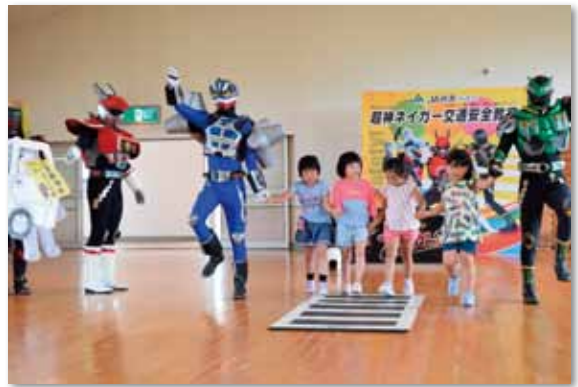
横断歩道は左右確認してから渡ります！

最後は、ネイガーと先生、園児全員で交通安全体操を踊り、会場は大いに盛り上がりました。