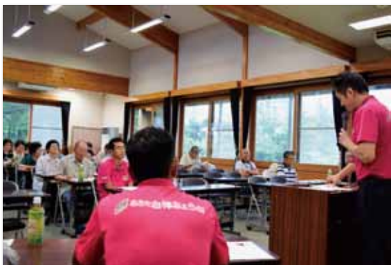
出荷規格を確認するみょうが部会