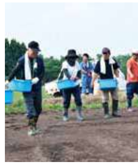
ムラなく丁寧に播きました