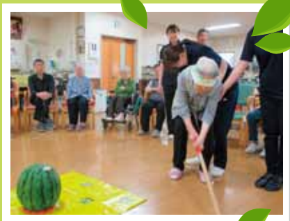
P12 福祉介護課だより