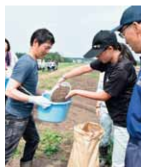
農業クラブの生徒が分配しました