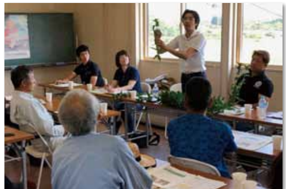
規格について懇切丁寧に指導いただきました。

地域振興局農業普及振興課は「この時期一番注意してもらいたいのは黒斑病。菌自体は弱いので、発生したらすぐに防除し、被害が広がらないよう気をつけてもらいたい」と呼びかけました。