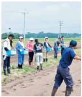
一列に並び横に4往復×5