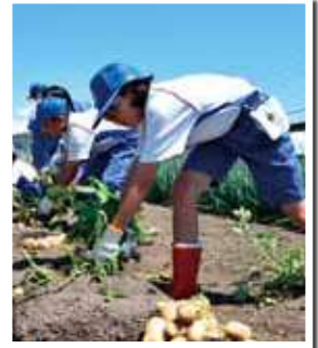
なかなか抜けないよ～