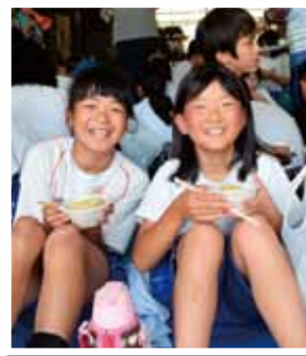
みんなで食べればおいしさupよ～