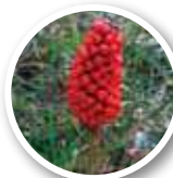
秋にはこんな実をつけます。