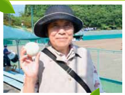
P3 孫のホームランボールを手に取りニコリ