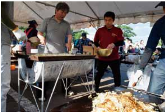
鉄板2枚で豪快に作り上げました！