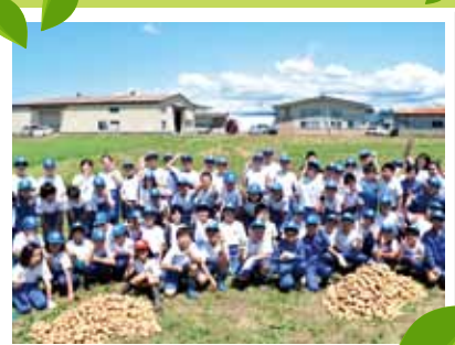
P13 地域のきずな～女性部活動～