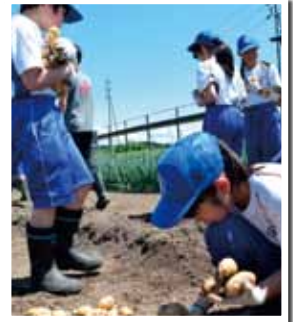
もう持ちきれないよ～