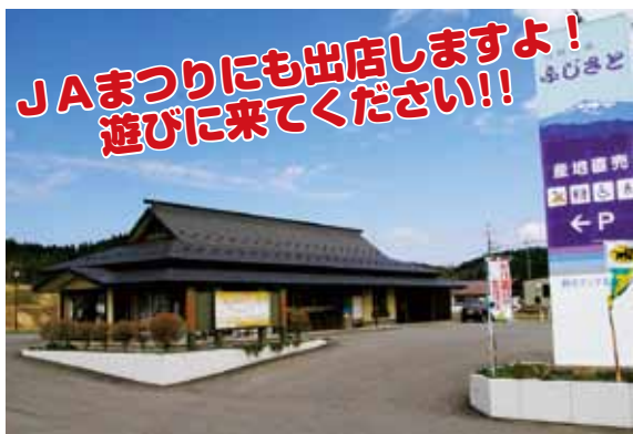
白神街道ふじさと