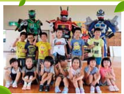
P11 夏休み交通安全守って元気に遊びます!