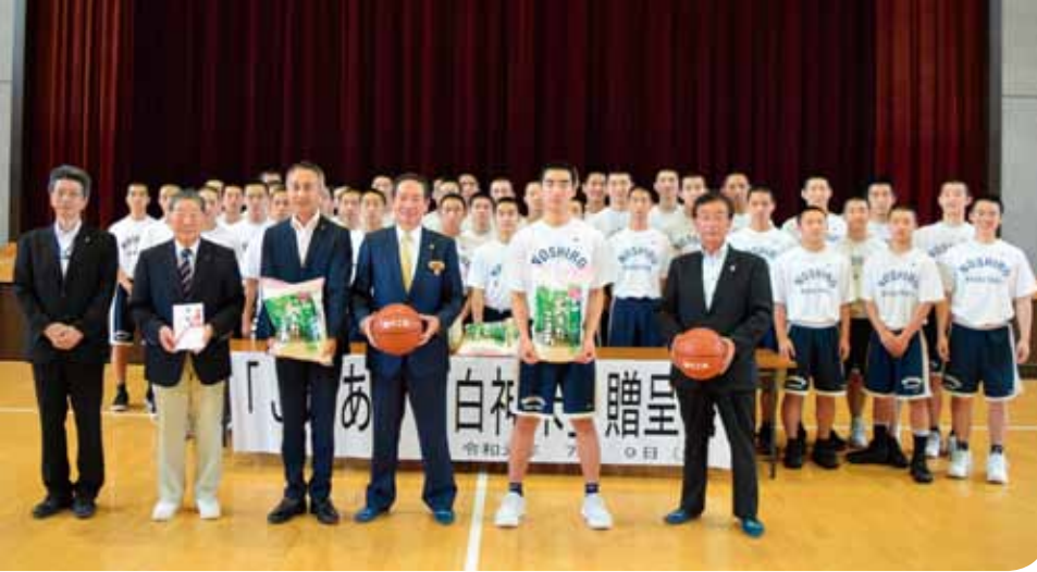
令和初の全国覇者を目指す能工バスケット部49名