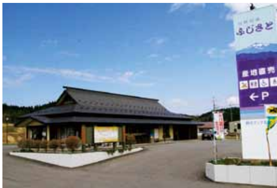
白神街道ふじさと