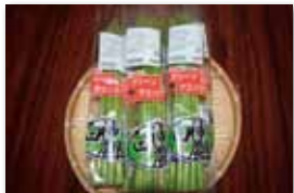
アスパラガス 100~250円/1袋