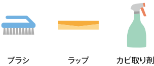
ブラシ ラップ カビ取り剤