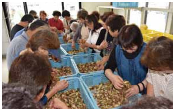
▲昨年の『みょうが袋詰め放題』の様子