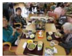
↑おいしいきりたんぼを、楽しくみんなで食べました

また、常盤小学校の4年生が来所し、機能訓練などのお手伝いをしてくれました。元気で可愛らしく一生懸命頑張る姿を見て、利用者様も笑顔で楽しむことが出来たと話しておりました。