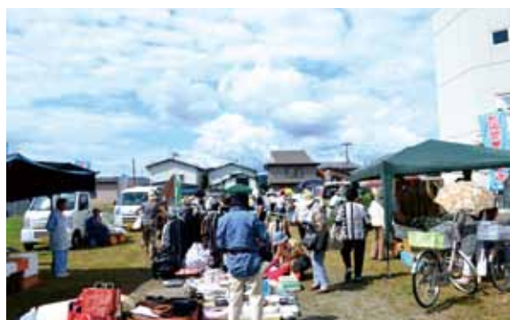
▲『きみ恋軽トラ市』の様子