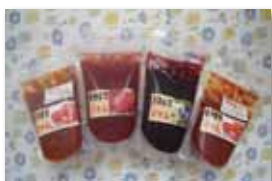
きみまちジャム(各種) 240円/130g