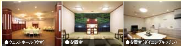
●ウエストホール(控室)