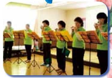
△コカリナの会の皆様が、素敵な演奏して頂きました♡