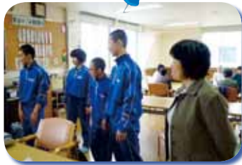
△常盤中学校の生徒と先生が来所し、平行棒を寄贈してくれました！