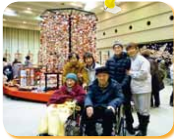
△つるし雛を見てきました。「みごとだなあ〜」