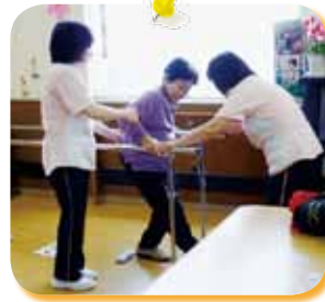
△頂いた平行棒で、曲がってら腰も伸びるよ♡