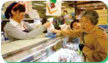
△買い物レクで、美味しいケーキを買っちゃいました♪