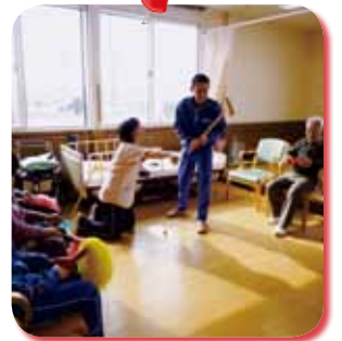
△生徒たちと一緒に、ゲートボールを楽しみました☆