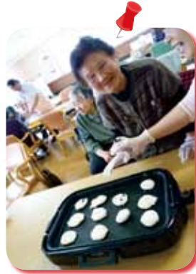
△桜色のおやきを、みんなで作りましたよ☆