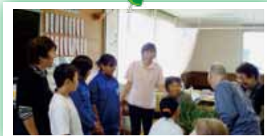
△淳城西小学校の児童が、自分たちで作ったねぎをプレゼントしてくれました！！