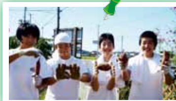
◁東中学校の生徒が職場体験で、イモ掘りをしてくれました！