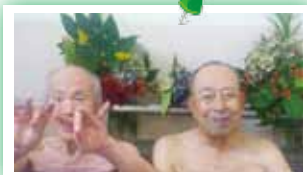
▶いい湯かげんに、おもわずニッコリ