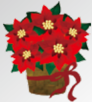
今月の花 「ポインセチア」