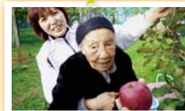
◁美味しそうなりんごですな。 「あんだも食うが？」