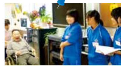
◁南中学校の生徒が職場体験。 可愛らしい姿に、みんなメモロでした♡