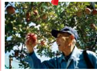
△真っ赤に色づいた実を収穫♪ 待望のりんご狩りです！