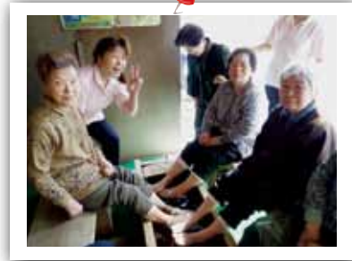
↑ 森岳の足湯に行ってきました。 「いいあんべ、いんあんべ!」