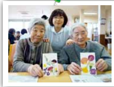
↑ 利用者様が好きな花で、押し花に挑戦です☆