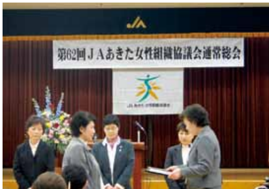
▲2部門において表彰を受ける当JA女性部

県内のJA女性部活動等について協議を行う、JAあきた女性組織協議会の第62回通常総会が、4月16日に秋田市のJAビルで開催されました。総会では、平成24年度の事業報告や平成25年度の事業計画、役員改選など全5議案が協議されたほか、T P P参加に断固反対する特別決議も行