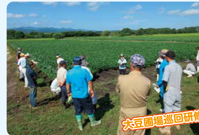
大豆圃場巡回研修