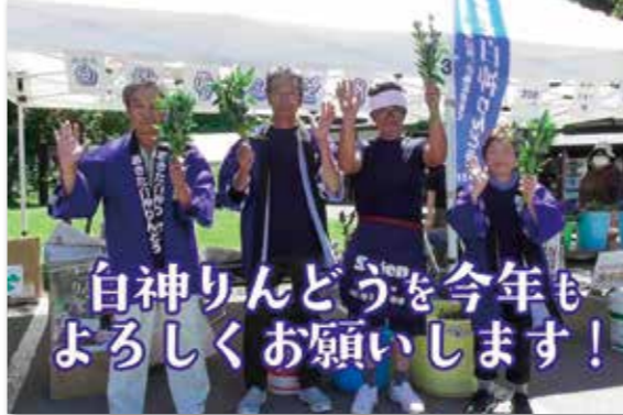
完成したPR動画(一部抜粋)