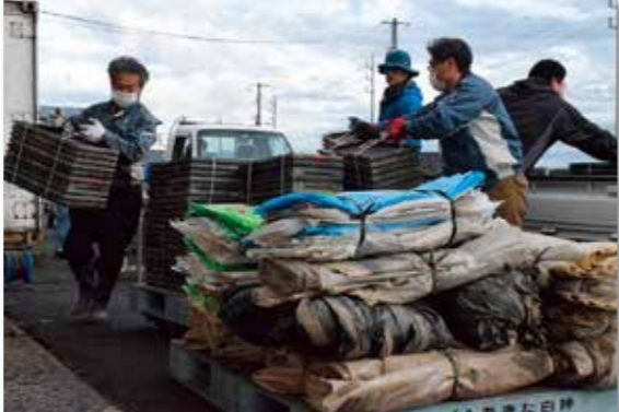
手際よく荷下ろし作業するJA職員

今と農家による農産物の生産と販売のサイクルは、秋の収穫から翌年の春の播種まで約1年を要する。この間に農家は多くのプラスチック資材を使用している。しかし、これらの資材は適切に処理されず、環境汚染の原因となっている。JAは、農家の意識を高め、適正な処理を促すための取り組みを行っている。具体的には、プラスチック資材の回収・リサイクルの仕組みを整え、農家の負担を軽減している。また、環境教育の一環として、子どもたちにもプラスチックの大切さを伝える活動を行っている。農家は、環境に優しい農業を実現するために、プラスチックの適正な処理を心がけよう。