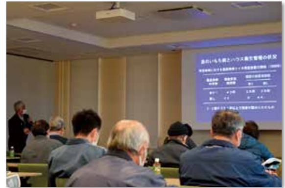
講師の説明を熱心に聴講する参加者