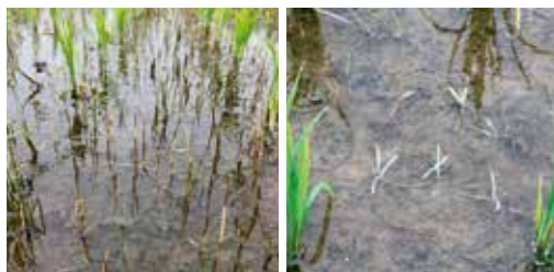
(6月5日田植、6月14日散布、8月7日撮影)