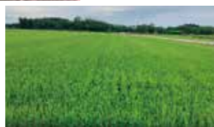
(6月4日田植、6月7日散布、7月11日撮影)