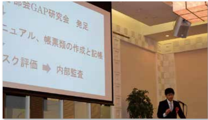
プロジェクターを用いて活動内容を発表