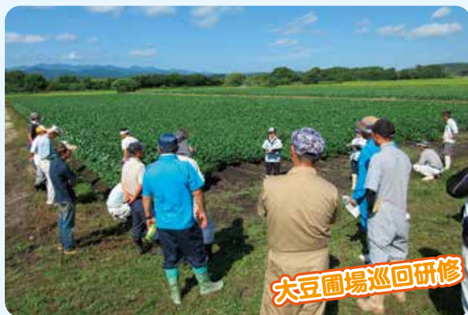
大豆圃場巡回研修