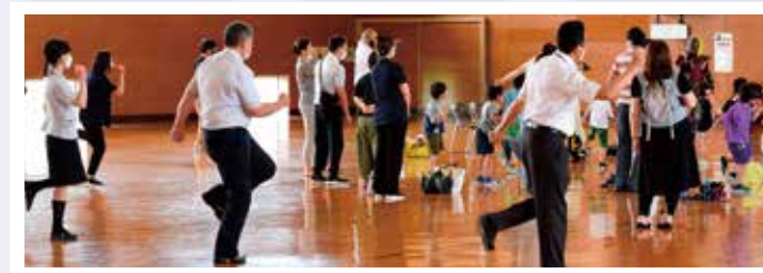
最後は園児と一緒にJA職員も交通安全体操!