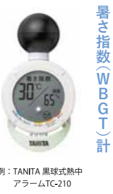
例：TANITA 黒球式熱中アラームTC-210

暑さ指数(WBGT)に基づく熱中症警戒レベルを5段階のイラストで表示。暑さ指数が設定値(出荷時は33)以上になったときはアラーム音でお知らせします。