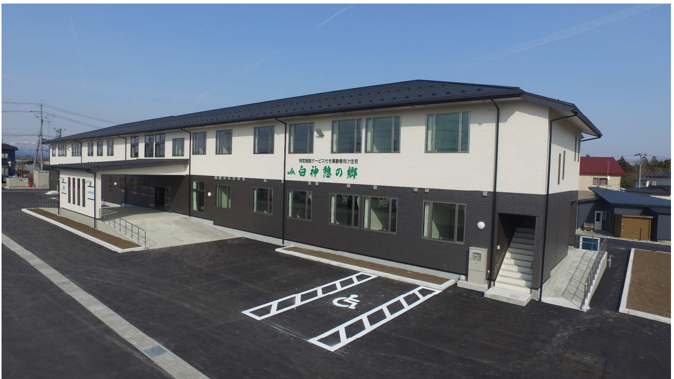
5月に完成した特定施設サービス付き高齢者向け住宅「白神憩の郷」